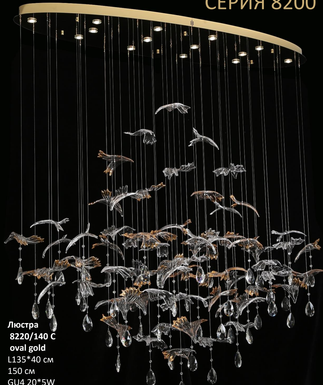
Люстра 8220/140 C oval gold L135*40 см 150 см GU4 20*5W